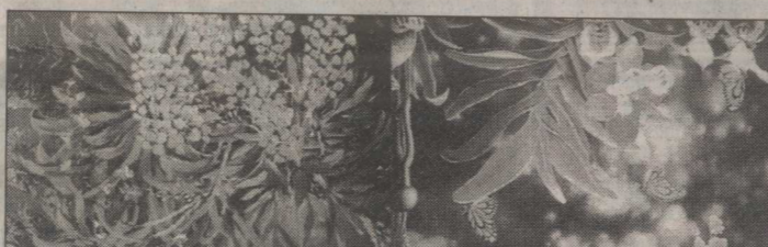
ประกวดวันที่ 3 พฤษภาคม พ.ศ.2547