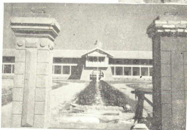
ประตูเข้า The entrance