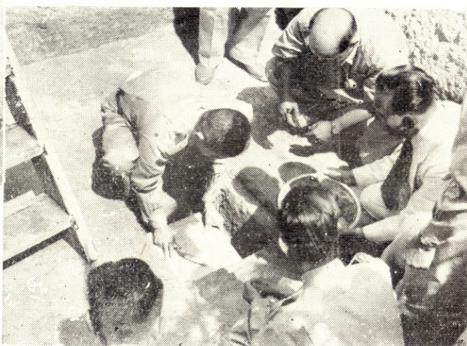
วางศิลาฤกษ์ Laying the corner-stone